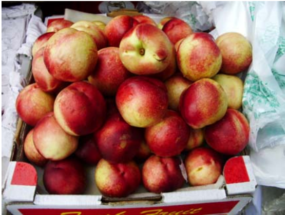
ภาพที่ 39. ท้อ (Peach)