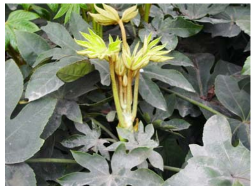
ภาพที่ 32. พรรณไม้ที่ไม่รู้จักชื่อ