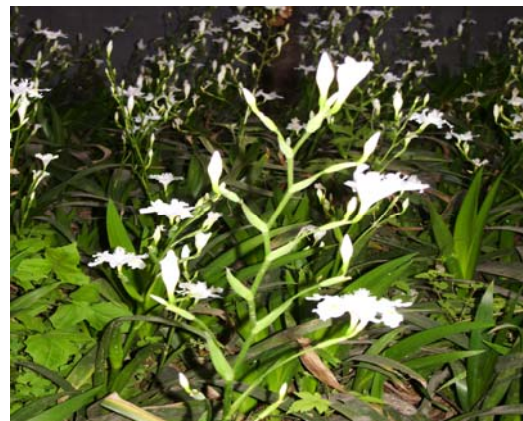
ช่อดอกไอริสขาว