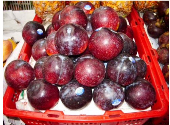
ภาพที่ 40. พลัม (Plum) หรือ ลูกไหนด