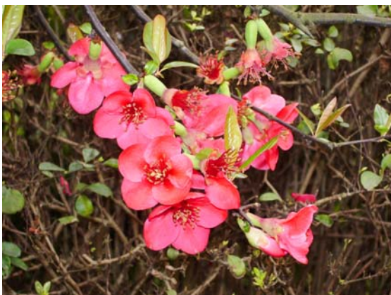
ภาพที่ 25. พลัม(Plum)