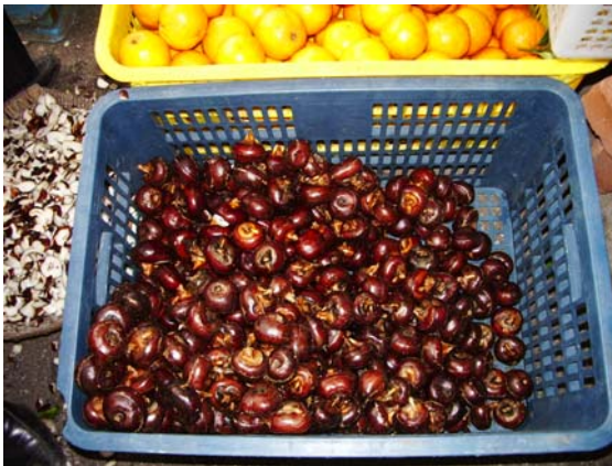
ภาพที่ 41. แห้วจีน