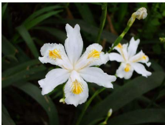
ดอกไอริสขาว