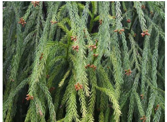
ภาพที่ 24. สนกำลังออกดอก(Pine)