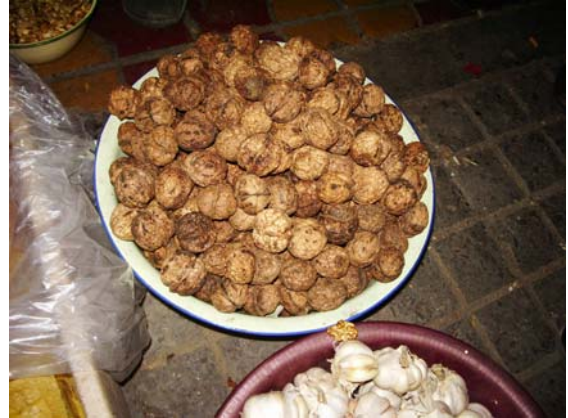
ภาพที่ 34. เมล็ดวอลนัท (Walnut)