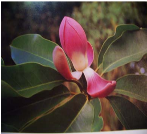
ภาพที่ 6. มณฑาดอย

ดอกไม้สวยในประเทศจีนสำหรับฤดูนี้ อีกชนิดหนึ่งที่สร้างความประทับใจให้แก่ผู้พบ เห็นไม่แพ้ 2 ชนิดที่กล่าวมาแล้วก็คือ คามเมลเลีย ( Camellia ) (ภาพที่ 7) ซึ่งมีดอกคล้ายกุหลาบ หลายคนมักว่าเป็นกุหลาบพันปีบ้าง กุหลาบ แดงบ้าง แท้จริงแล้วมีชื่อเฉพาะว่าคามเมลเลีย ไม่มีชื่อไทย ที่พบเสมอตามสถานที่ไปดูงานจะ เป็นดอกสีแดง (ภาพที่ 8) ต้นไม้ใหญ่มากเพียง 1-2 เมตร พบที่วัดเป้ากว้อ 2 ต้น ปลูกไว้ที่ลาน สักการะ ต้นสูง 2-3 เมตร ทรงพุ่มใหญ่ ดอกดก มาก ปริมาณดอกกับใบที่มีอยู่ใกล้เคียงกัน ต้น หนึ่งดอกสีชมพูเข้ม ส่วนอีกต้นหนึ่งเป็นดอกสี ขาวซึ่งหาดูได้ยากกว่า ดอกบานไม่ทนกลีบดอก ร่วงเร็ว หลายคนเข้าไปพิสูจน์ใกล้ๆว่าไม่ใช่ ดอกกุหลาบ เพราะหน้าตาคล้ายดอกกุหลาบ จริงๆ เมื่อเห็นใบแล้วจะรู้ว่าใบคล้ายใบชา สำหรับท่านที่เคยเห็นไร้ชา ไม่ใช่เรื่องแปลก หากจะบอกว่าคามเมลเลียเป็นพืชในวงศ์เดียวกัน กับชาที่นำมาชงดื่ม นั่นเองคือ วงศ์เทียซี้อี้ (Theaceae) เพียงแต่ดอกชาเป็นดอกสีขาวกลีบ ดอกชั้นเดียว ในประเทศไทยก็มีดอกไม้ช่อดาว ชื่อวิทยาศาสตร์ว่า Franklinia alatamaha ที่ เป็นญาติกับคามเมลเลีย ที่เรียกช่อดาวเพราะกลีบ ดอกสีขาวมี 5 กลีบล้อมเกสรสีเหลืองหลายร้อย อันไว้โดยรอบ แม้ว่าดอกจะไม่ดกแต่ความสวย งามสามารถจูงใจให้ผู้รักต้นไม้ชื้อหามาปลูก ประดับสวน