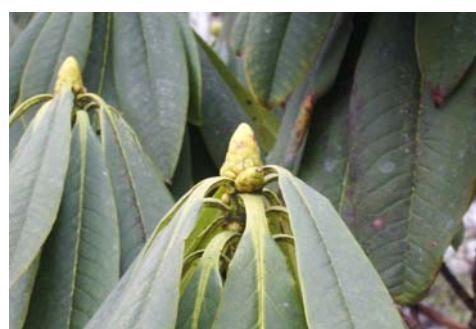
ภาพที่ 2. ตระกูลโรโดเดนดรอน

เนื่องจากเกษตรกรปลูกแร็ปลีดได้สม่ำเสมอ บำรุงรักษาดีจึงออกดอกพร้อมกันทั้งหมด ไม่มีวัชพืชปะปนเลย แปลงปลูกเป็นแนวขอบเขตชัดเจนเพิ่มความสวยงามมากยิ่งขึ้น นับเป็นความโชคดีที่ได้เดินทางมาที่เมืองนี้ในช่วงที่กำลังออกดอกอย่างเต็มที่พอดี อีกเพียงไม่กี่วันกลีบดอกสีเหลืองอร่ามเหล่านี้ก็จะร่วงโรย แล้วติดฝักและเมล็ดให้เก็บเกี่ยวภายในอีก 1 เดือนต่อมา เนื่องจาก แร็ปลีดเป็นพืชล้มลุกอายุเก็บเกี่ยวเมล็ดเพียง 3-4 เดือน เมื่อฝักแห้งต้นก็จะตายไป เกษตรกรชาวจีนและเมืองหนาวหลายแห่งในโลกนี้ปลูกแร็ปลีดเพื่อสกัดเอาน้ำมันสำหรับปรุงอาหารเหมือนน้ำมันพืชชนิดอื่นๆ เมื่อมีโอกาสเข้าไปชมสินค้าในแผนกเครื่องครัวของซูเปอร์มาร์เก็ตในฉินตู ก็ไม่รอช้าที่จะตรงไปแผนกน้ำมันพืชซึ่งได้พบน้ำมันแร็ปลีดบรรจุภาชนะขนาด 3 ลิตร ราคา 18 หยวน หรือ 90 บาท อยากซื้อขวดเล็กแบบที่ประเทศไทยมาอดเพื่อนๆ ก็ไม่มี ขอถ่ายภาพก็ไม่ได้เนื่องจากผิดกฎของห้างเลยไม่มีรูปขวดน้ำมันแร็ปลีดมาประกอบให้ชม