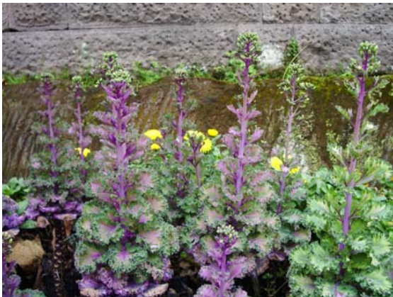
ภาพที่ 23. ดอกของกะหล่ำปลีประดับ(Ornamental cabbage)