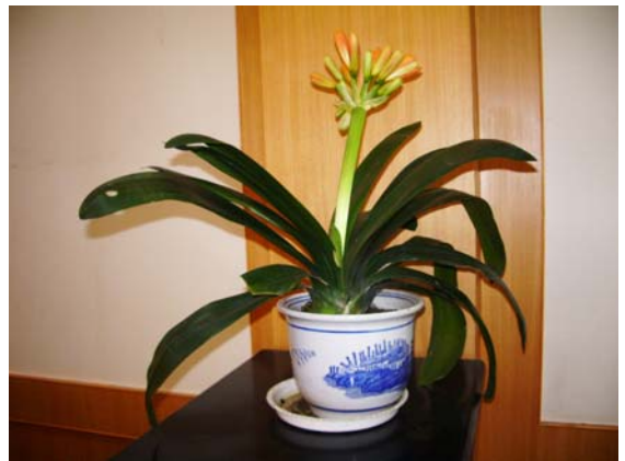
ภาพที่ 30. คีเวีย( Kevia )