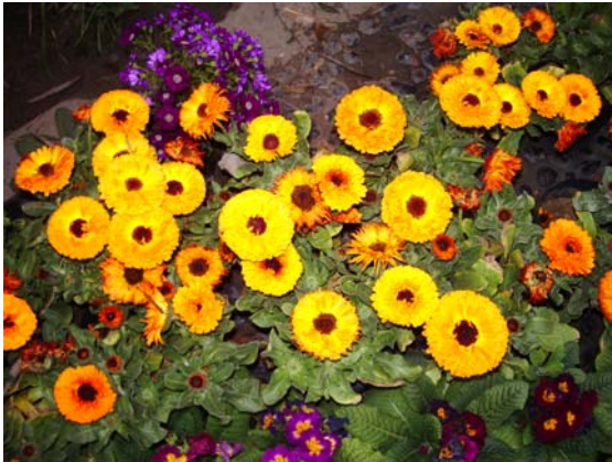
ภาพที่ 21. ดาวเรืองหม้อ(Calendula)