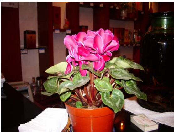
ภาพที่ 29. ไชคลาเม้น( Cyclamen )