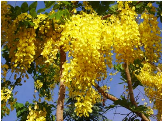
ภาพที่ 11. ราชพฤกษ์