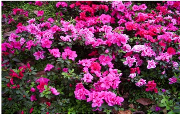
แปลงปลูกอะซาเลียในมหาวิทยาลัยจิ้งฉิ่ง