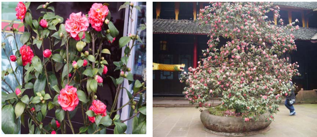
ภาพที่ 8. คามेलเลียแดงและคามेलเลียชมพู

ดอกไม้ยอดนิยมของนักท่องเที่ยวทั่วโลกคือดอกซากุระ (sakura) (ภาพที่ 9 และ 10) ช่วงนี้ดอกซากุระบานทั่วโลกทั้งที่ญี่ปุ่น จีน อเมริกา และที่อื่นๆ ที่ประเทศอเมริกามีเทศกาลชมดอกเชอร์รี่ (Cherry) ทั้งเชอร์รี่ ซากุระ ท้อ บ๊วย พลัม(ลูกไหนด) โคลวิท(ปีแป๊ะ) แอปเปิ้ล สาลี่ และสตอเบอร์รี่ ต่างก็เป็นพืชในวงศ์กุหลาบ (Rosaceae) ทั้งสิ้น ธรรมชาติสร้างมาให้พืชทุกชนิดในวงศ์นี้ดอกสวย เมืองไทยมีที่ดอยแม่สลอง จังหวัดเชียงราย ชื่อดอกพญาเสือโคร่ง ก็