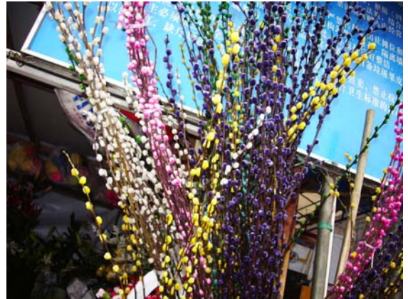
ภาพที่ 28. พุชซี่(Pussy)