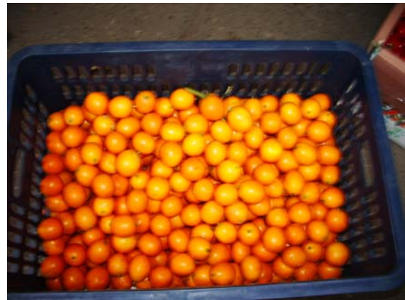
ภาพที่ 42. ส้มกินเปลือก หรือส้มจิ้มจ้อ