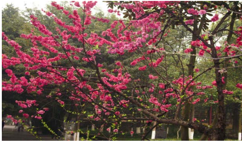
ภาพที่ 10. ซากุระแดงดอกซ้อน

ในประเทศไทยมีดอกไม้ที่สวยงามไม่แพ้กันและบานในช่วงเดียวกับซากุระคือ ตะแบก กัลปพฤกษ์ ราชนพฤกษ์ และหางนกยูง (ภาพที่ 11-14) นักท่องเที่ยวจากต่างประเทศต้องตะลึงกับสีส้มที่จัดจ้านและดอกกลมไม่แพ้กัน เพียงแต่ยังไม่มีคนคิดทำสวนเพื่อขายทัวร์ดอกไม้บาน อย่างเป็นทางการเป็นต้น ที่เห็นมีอยู่ก็คือดอกบัวตอง