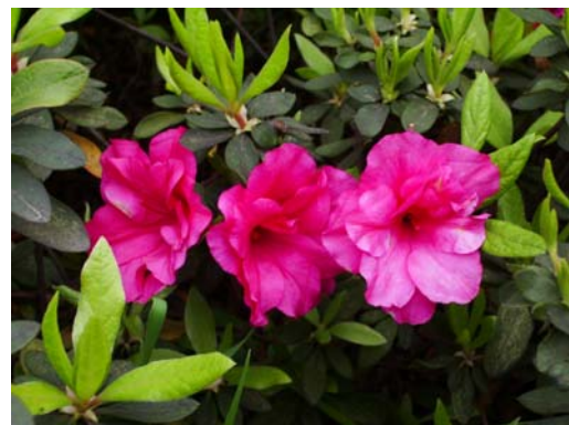
อะซาเลียแดง