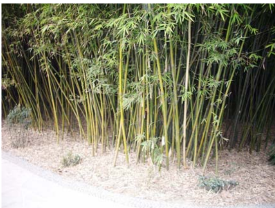
ภาพที่ 43. ไม้สำหรับหมีแพนด้า