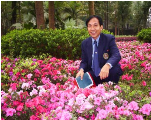
แปลงปลูกอะซาเลีย