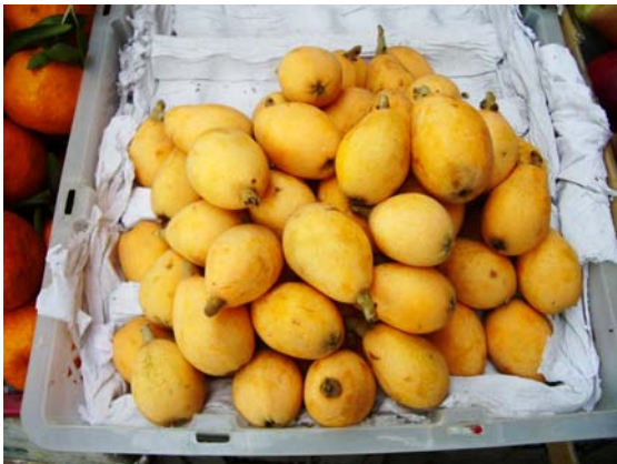
ภาพที่ 35. โลควี้อท หรือปีแป้