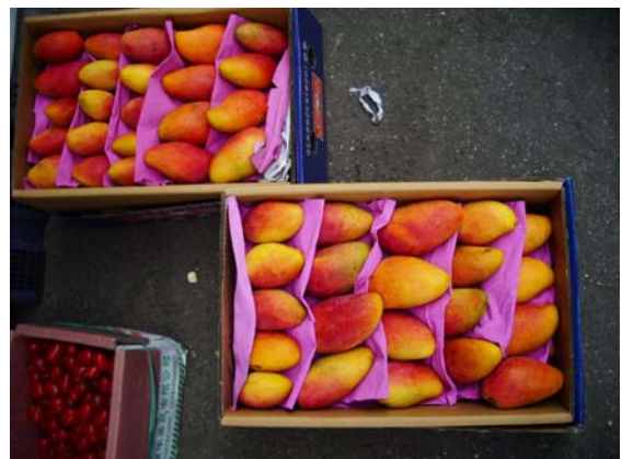
ภาพที่ 38. มะม่วงแดง