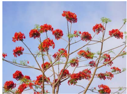
ภาพที่ 12. หางนกยูง