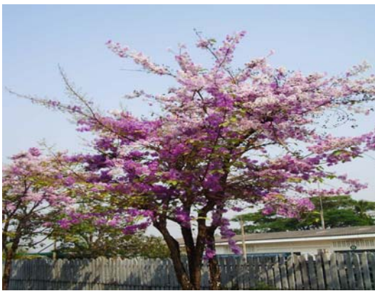
ภาพที่ 13. ตะแบก