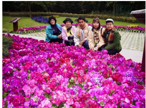
ภาพที่ 18. เจอราเนียม