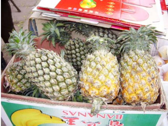
ภาพที่ 33. สับปะรด

เช่น มณฑลยูนนาน ซึ่งมีภูมิอากาศใกล้เคียงกับทางภาคเหนือของไทย ผลไม้เท่าที่พบมีดังนี้ (ภาพที่ 33-44)