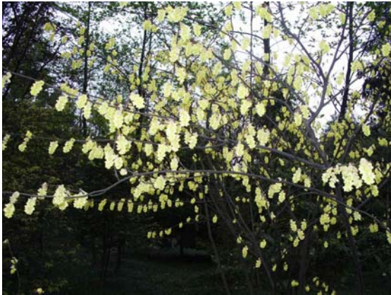
ภาพที่ 27. คาริลออปซิส( Carylopsis sp.)