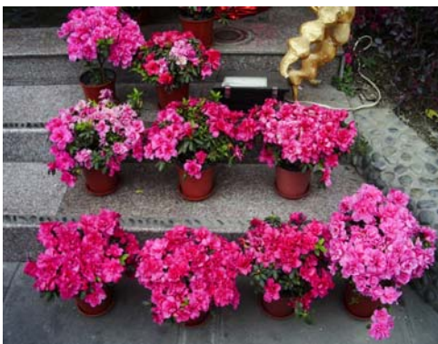
อะซาเลียประดับสถานที่