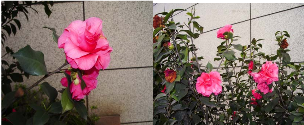
ภาพที่ 7. ดอกคามेलเลีย