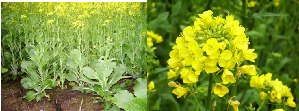
ภาพที่ 3. แร็ปส์ีด

ขออธิบายเรื่องของแร็ปส์ีดสักเล็กน้อย ดังนี้ มีชื่อสามัญว่า Rapeseed และมีชื่อสามัญ อื่นๆ อีกหลายชื่อเช่น rape และ rapa เป็นพืช ตระกูลผักกาด แร็ปส์ีดก็เป็นผักกาดกวาดวงศ์ ชนิดหนึ่งนั่นเอง ได้ถ่ายภาพระยะใกล้มาขึ้น ด้วย แร็ปส์ีดมีชื่อวิทยาศาสตร์ว่า Brassica napus อยู่ในวงศ์ Brassicaceae แร็ปส์ีดจะปลูกได้เพียง ปีละครั้ง หากพลาดชมในครั้งนี่ก็ต้องรอไปอีก 1 ปี ช่วงเดือนกุมภาพันธ์ถึงเมษายนเท่านั้น