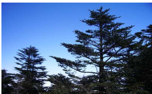
ภาพที่ 1. สนภูเขาบนยอดเขาจ้อไ้

สองข้างทางหลวงขนาดแปดเลนได้พบเห็นแปลงปลูกพืชดอกสีเหลืองที่ชื่อว่า แร็ปลีด (rapeseed) เต็มไปหมด (ภาพที่ 3) แปลงละหลายร้อยไร่รวมพื้นที่เพาะปลูกแล้วหลายหมื่นหลายแสนไร่ ทุกคนที่อยู่ในรถต้องชะเง้อคอขึ้นหน้าไปชื่นชมความสวยงาม บ้างก็ขอให้รถชะลอความเร็วลงเพื่อบันทึกภาพที่สวยงาม