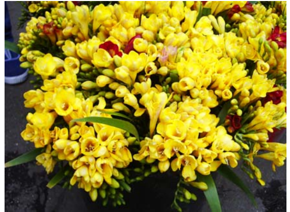
ภาพที่ 22. ฟรีเซีย(Fresia)