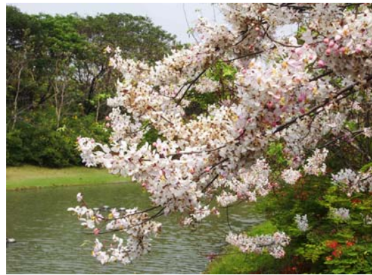
ภาพที่ 14. กัลปพฤกษ์

ไม้ดอกสวยที่ต้องกล่าวถึงอีกชนิดหนึ่งคือ อะซาเลีย (ภาพที่ 15) ซึ่งมีชื่อวิทยาศาสตร์ว่า Azalea simsii ต้นเตี้ยๆ เพียง 1-2 ฟุต แต่ดอกดกมาก ไม่ว่าจะปลูกในแปลงหรือในภาชนะก็เรียกร้องความสนใจให้ผู้พบเห็นได้ตลอดเวลา ไม่ว่าจะเป็นที่โรงแรม ภัตตาคาร ห้างร้าน ต่างก็ซื้อหาอะซาเลียมาตั้งประดับตกแต่งทั้งภายในภายนอกอาคาร แปลงปลูกอะซาเลียในมหาวิทยาลัยจึงซึ่งสวยงาม โดยปลูกหลายสีสลับกันตั้งแต่สีครีม ชมพูอ่อน ไล่เรียงไปจนถึงชมพูเข้ม แดง และแดงอมม่วง ในบริเวณศูนย์อนุรักษ์พันธุ์หมีแพนด้าตกแต่งสถานที่ด้วยไม้