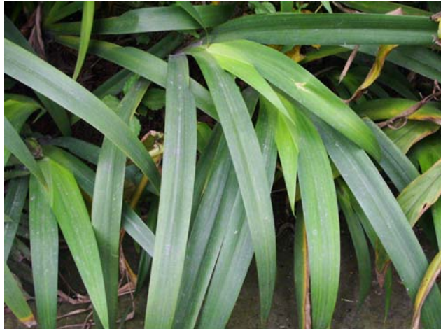
ใบไอริสขาว