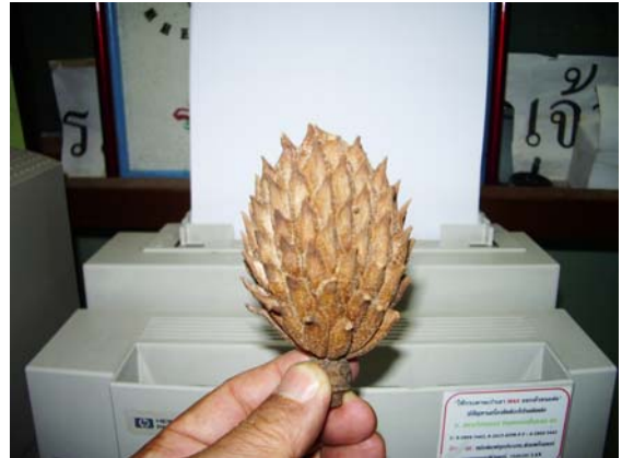
ภาพที่ 5. ดอกและผลของแม็กโนเลีย

แม็กโนเลียมีชื่อวิทยาศาสตร์ว่า Magnolia soulangeana เป็นพืชในวงศ์ Magnoliaceae ชื่อสามัญว่า Saucer magnolia เป็นพืชในวงศ์