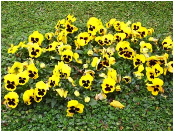
ภาพที่ 17. หน้าแมว

นอกจากนี้ยังมีไม้ดอกอีกหลายชนิดที่ สวยงามไม่แพ้กัน สร้างสีสันให้สถานที่น่า ประทับใจอย่างยิ่งทั้งที่รู้จักและไม่รู้จัก (ทั้งที่ได้ พยายามค้นคว้าแล้ว) อีกกว่า10 ชนิด ขอกล่าวถึง พรรณไม้ที่รู้จักพร้อมภาพประกอบดังนี้ ดอก หน้าแมว(Pansy) (ภาพที่ 17) มีหลายสี ทั้งขาว เหลือง แดง ฟ้า และม่วง เจอราเนียม (Geranium) (ภาพที่ 18) มีหลายสีทั้งขาว ครี มชมพู และแดง แอสเตอร์ (Aster) (ภาพที่ 19)