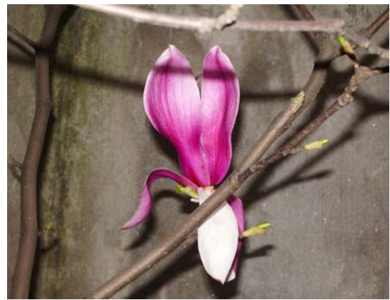
ภาพที่ 4. แม็กโนเลีย (ก) ดอกสีขาว และ (ข) ดอกสีชมพู