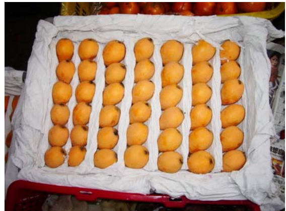
ภาพที่ 36. โลควี้อท (Loquat)