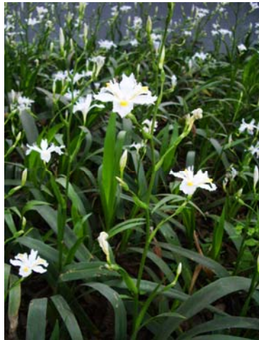
แปลงปลูกไอริสขาว

Belamcanda chinensis ใบแบนซ้อนกันเป็นชั้นๆ ส่วนต้นไอริสขาวที่กำลังกล่าวถึงไม่เคยเห็นในเมืองไทยนั้นดอกสีขาวบริสุทธิ์ กลีบนอก 3 กลีบยาวกว่า ส่วนกลีบใน 3 กลีบสั้นและกว้างกว่า มีแถบสีเหลืองเป็นลายเส้นระบายอยู่พองาม ขอบปลายกลีบหยักปลิวเล็กน้อย เป็นพืชที่น่าสนใจเพราะช่อดอกยาว ดอกตก หากนำมาปลูกเป็น ground cover ในเมืองไทยได้ก็จะพบไม้ประดับดอกขาวอีกชนิดหนึ่ง