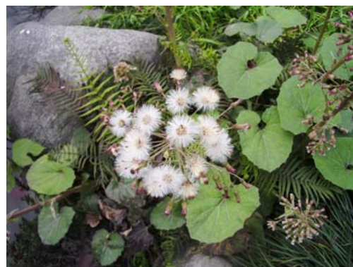
ภาพที่ 31. พรรณไม้ที่ไม่รู้จักชื่อ