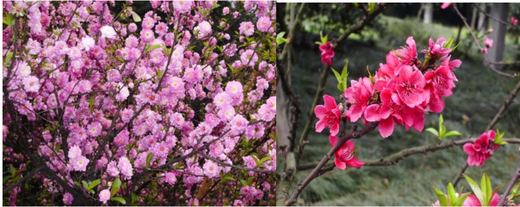
ภาพที่ 9. ซากุระชมพูดอกซ้อนและซากุระแดง