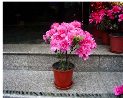
อะซาเลียในกระถาง