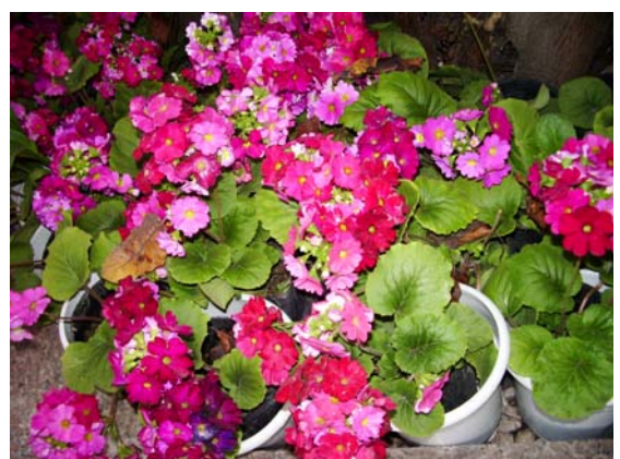
ภาพที่ 20. ซินเนอราเรีย

แต่เป็นพันธุ์ที่กลีบดอกไม่ละเอียดมีหลายสี แม้กระทั่งสีเขียว ซินเนอราเรีย (Cineraria) (ภาพ ที่ 20) หลายสีทั้งชมพู แดง ม่วง และสีสลับ ปลุกได้ดีที่จังหวัดเชียงใหม่ และพรรณไม้อื่นๆ ดังภาพที่ 21-30