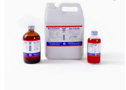
ตัวอย่างยาขับลม (Mist. Carminative)

( https://vidhyasom.com/product/soda-millions-300-mg/ )