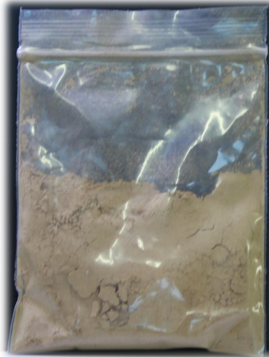
ยาหอมเทพจิตร