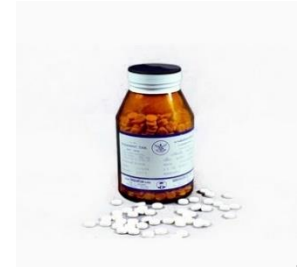
ตัวอย่างยาโซดาบิคาร์บอเนต

เป็นยาน้ำ บรรเทาอาการจุกเสียด ลดอาการระคายเคือง เนื่องจากมีกรดมากในกระเพาะอาหาร