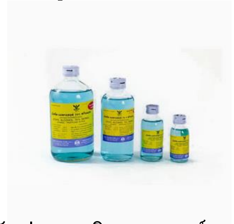
ตัวอย่างยาเอทิลแอลกอฮอล์