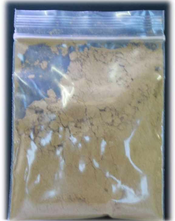
ยาหอมทิพโอสถ